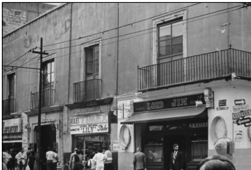
Otro edificio sede ubicado en la calle de Bolívar núm. 57.