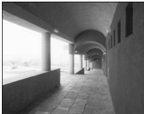
Instalaciones en Juriquilla.