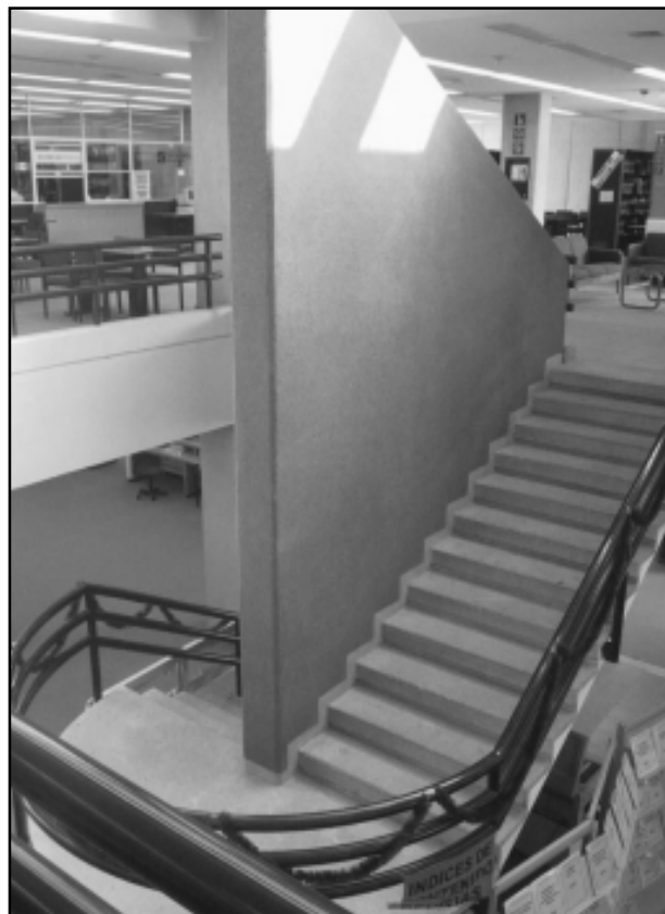
Interior de la Biblioteca C.P. Wilfrido Castillo Miranda.

Inaugurada el 20 de marzo de 1998 con la finalidad de proporcionar un servicio especializado principalmente a los alumnos y egresados que realizan sus estudios a nivel de maestría, de doctorado y de especialización, y a todos aquellos interesados en la investigación. Esta biblioteca, cuyo nombre responde a uno de los ex directores más prominentes de esta institución, cuenta con 412 títulos de revistas en distintos idiomas y 80 revistas con suscripción vigente.