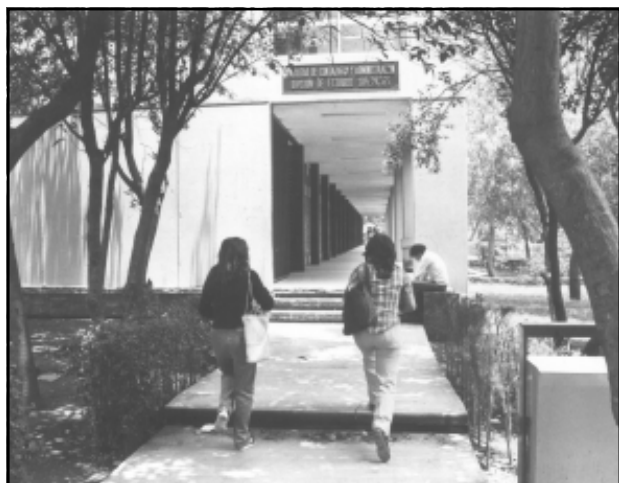
Edificio que albergó la División de Estudios Superiores.

En 1986, y dentro de Ciudad Universitaria, se inaugura el primer edificio diseñado ex profeso para la biblioteca, que en ese tiempo es catalogada como la más grande de América Latina; su construcción se realizó con esfuerzo de alumnos,