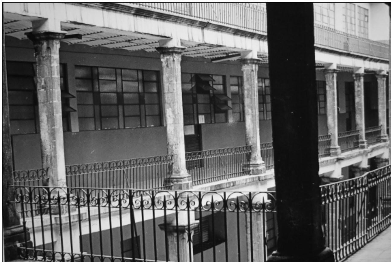
Interior de la sede del Cuartel de Zapadores.