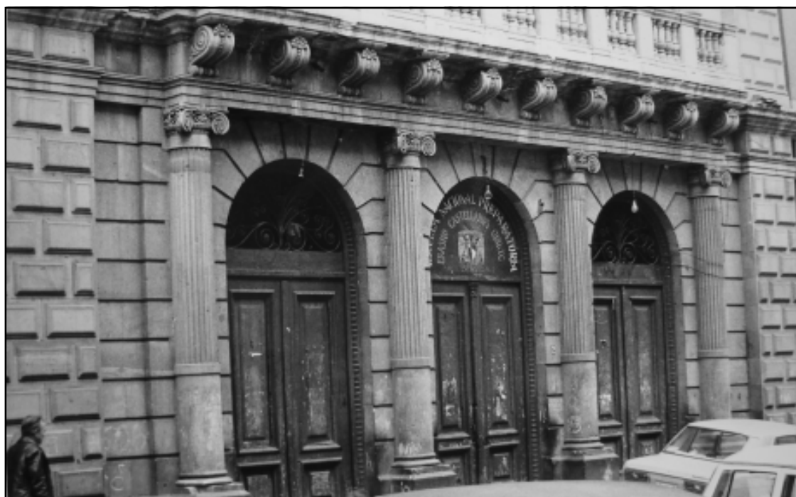
Edificio ubicado en la calle Primo Verdad núm. 2, segunda sede de la FCA.

*Nota aclaratoria: Los datos e información que contiene este capítulo fueron tomados principalmente del video-documental "Sedes de la Facultad de Contaduría y Administración", realizado por el C.P.C. y Maestro Arturo Díaz Alonso.