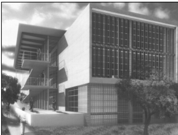
Nuevas instalaciones del CICA.

Actualmente se construye el Centro Avanzado de Cómputo, una magna obra que contará con una infraestructura acorde a las exigencias del siglo XXI. Está ubicado detrás de la biblioteca “C.P. Alfredo Adam Adam” y contará con equipo y tecnología de punta que estará al servicio de alumnos y profesores.